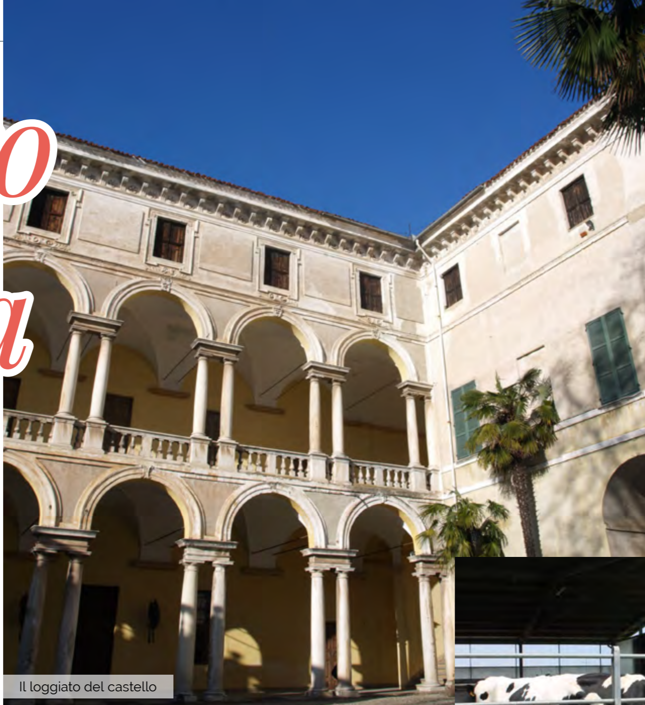
Il loggiato del castello