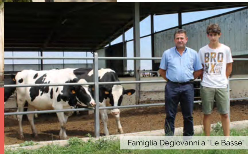
Famiglia Degiovanni a “Le Basse”