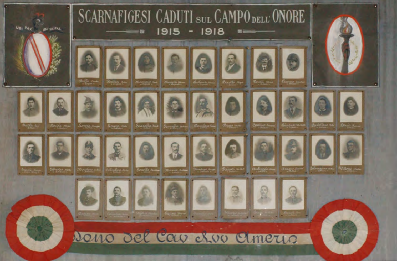
Il quadro dei Caduti della Prima Guerra mondiale esposto nella Sala consigliare di Scarnafigi

tributo umano pagato dalla nostra comunità, le statistiche dicono che a sole 58 nascite - per allora un numero assai basso - si contrapponevano 108 decessi, senza contare le devastazioni della guerra causate dalle malattie, come l'influenza spagnola. Sempre nello stesso anno si celebrò un solo matrimonio. Quaranta uomini di Scarnafigi morirono sul campo dell'onore, i reduci per i quali è dedicata la lapide nel cimitero del paese furono 123.