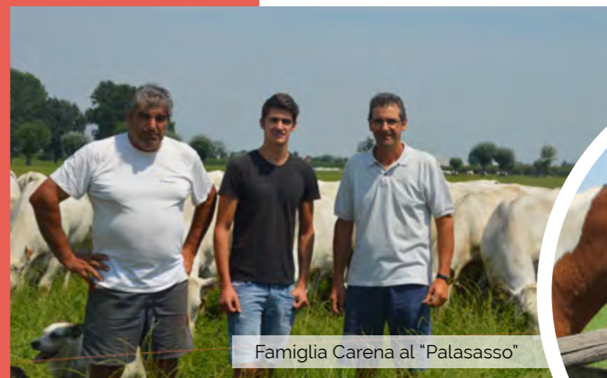
Famiglia Carena al “Palasasso”