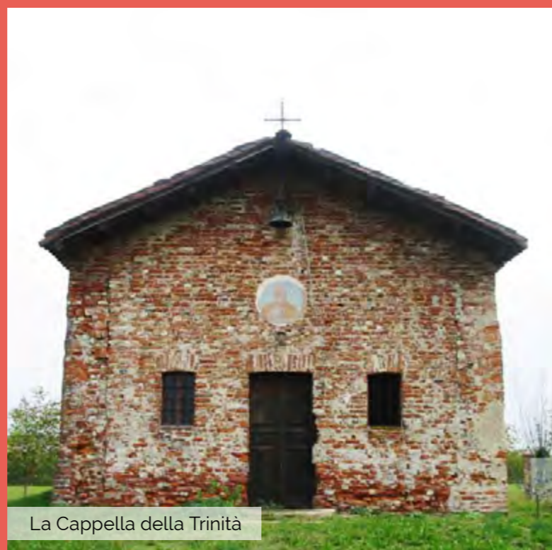
La Cappella della Trinità