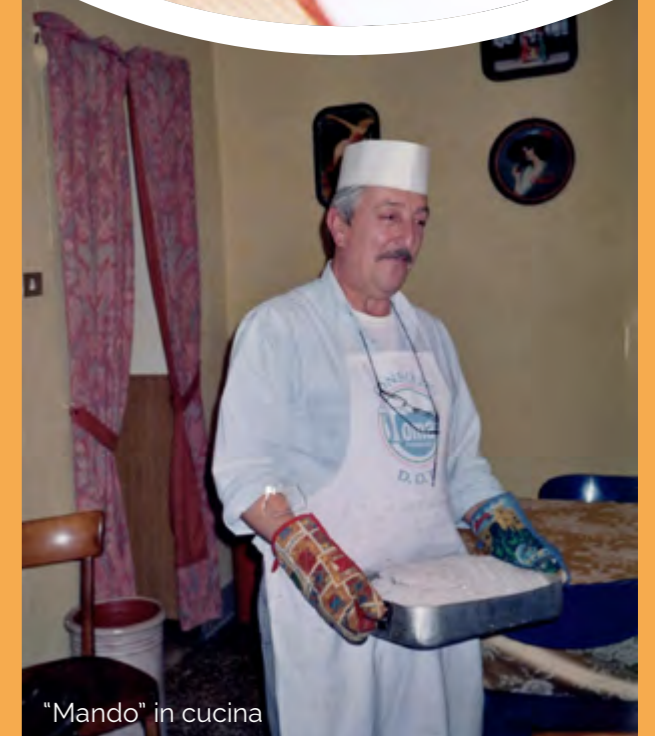
"Mando" in cucina