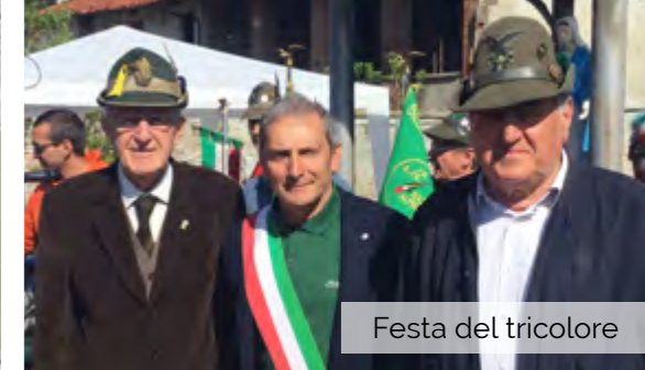
Festa del tricolore