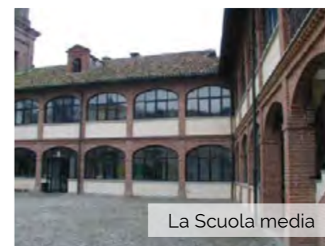
La Scuola media