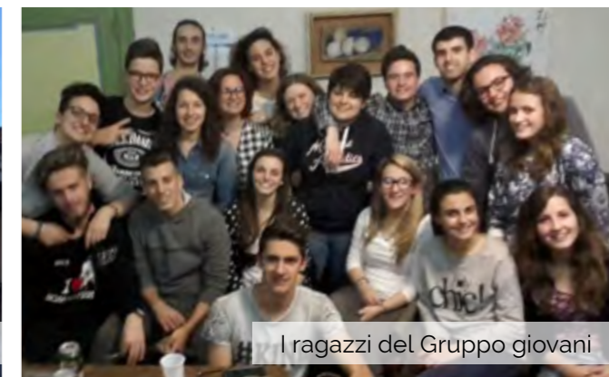
I ragazzi del Gruppo giovani

ranza assoluta del Consiglio e il sindaco ha commentato: «Penso che se ci sono imprenditori che ancora investono sul territorio, occorra incoraggiarli».