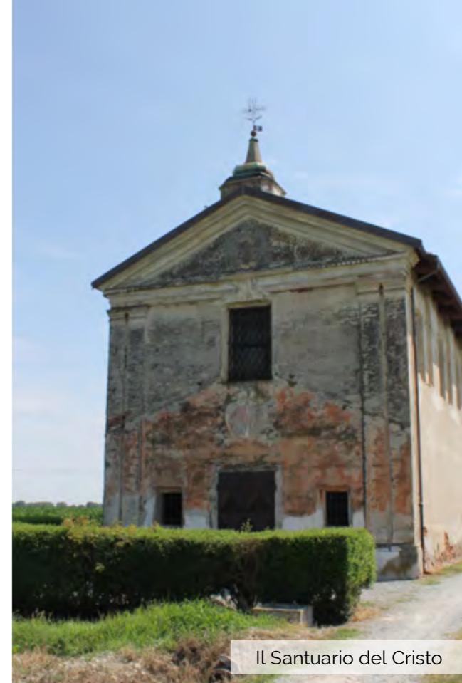
Il Santuario del Cristo

composizione degli stucchi originari si procederà alle operazioni di pulitura, consolidamento, stuccatura e ricostruzione delle parti mancanti.