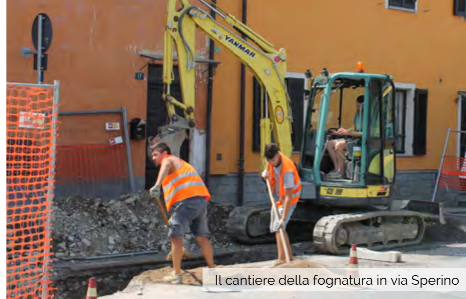
Il cantiere della fognatura in via Sperino

Il Santuario del Cristo è ricchissimo di stucchi. Vi sono purtroppo alcuni stucchi dove il grado di umidità è talmente elevato da portare in alcuni casi alla completa polverizzazione. Dopo aver studiato attentamente la