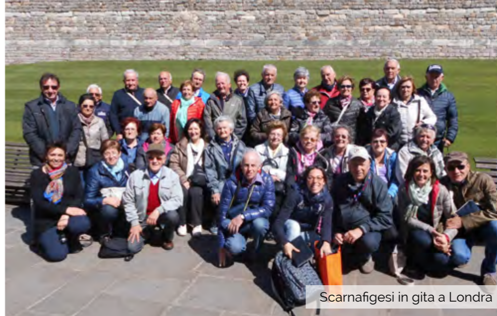
Scarnafigesi in gita a Londra

Il secondo punto affrontato è l'adeguamento alla legge statale per ampliare le possibilità di acquisto in forma semplificata per le stazioni appaltanti, alzando il valore dell'affidamento diretto da 20.000 a 40.000 euro. Anche questo provvedimento passa con il favore della maggioranza, mentre la minoranza si astiene. Si è poi votato su una richiesta di ampliamento strutturale della società scarnafigese Valgrana per allargare i propri ambienti: la richiesta è passata con la maggio-